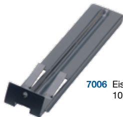
7006 Eishalter für Stuhlhöhe 100 mm oder 50 mm

Verhindert Durchrutschen von Eisplatten.