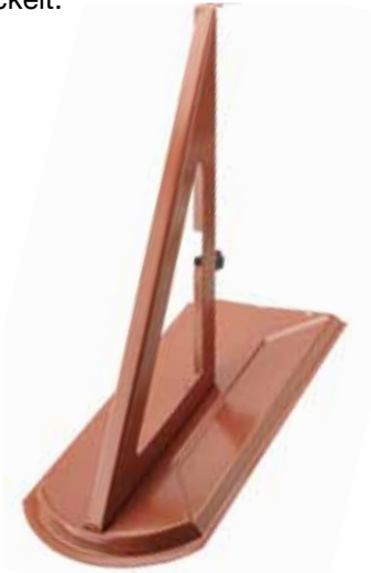
7340 PB-Solarschneefanggitterstütze 250 mm, Stuhlhöhe 100 mm , auf Metalldachplatte Biber genietet.

Durch die Montage von Solar- und Photovoltaikanlagen verändern sich die Anforderungen an die Schneefangsysteme . Damit wir diesen Ansprüchen gerecht werden, haben wir für diese Situation neue Schneefangstützen für Solar- und Photovoltaikanlagen entwickelt.