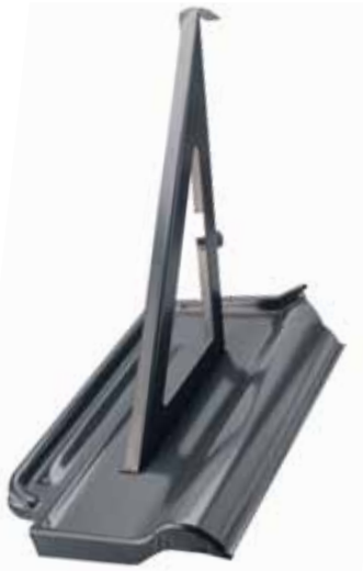
7340 PB-Solarschneefanggitterstütze 250 mm, Stuhlhöhe 100 mm , auf Metalldachplatte Flachdachpfanne genietet.